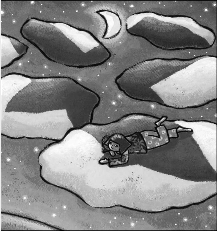
Abb. 4 aus Regine Schindler: Im Schatten deiner Flügel. Psalmen für Kinder . Illustriert von Arno. Düsseldorf 2005.

sprünglich gesungenen Texte der Psalmen lassen sich als eine Art „Gebetsformular“ in jede Zeit und damit auch in den heutigen Kinderalltag übertragen. Während in den üblichen Kinderbibeln die Psalmen oft ausgespart werden, hat Regine Schindler unter dem Titel „Im Schatten deiner Flügel“ 15 ein Psalmenbuch für Kinder herausgegeben. Die bildhafte, anschauliche Sprache dieser Texte bietet vielerlei Möglichkeiten, eigene Gottesbilder zu finden oder neue Gottesbegriffe kennen zu lernen, Dinge in Worte gefasst zu finden, die man selbst