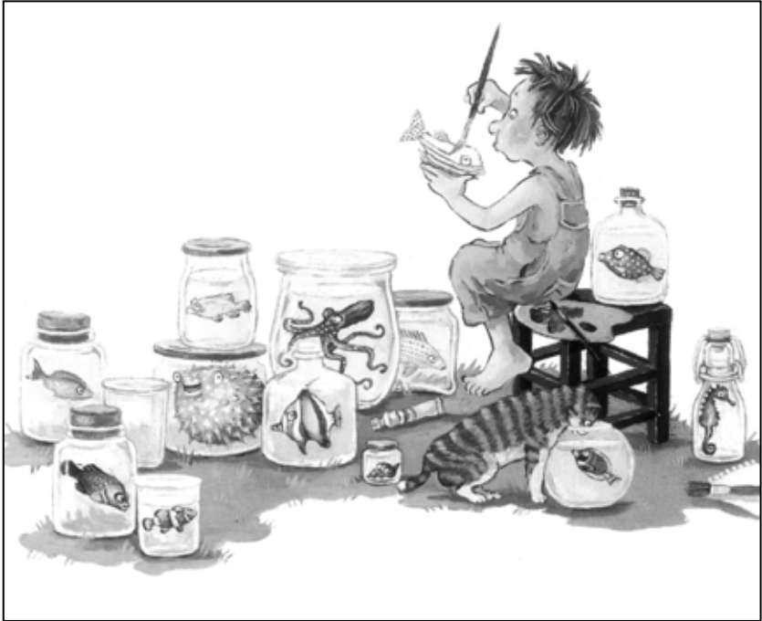
Abb. 3 aus Annette Swoboda: Der kleine Gott und die Tiere . Hamburg 2008.

sich die kindliche Protagonistin per Walkie-Talkie mit ihren Sorgen an Gott – und erhält tatsächlich Antwort von einer brummigen Männerstimme. Sie stellt fest, dass Gottes Stimme zu einem älteren Mann mit Alkoholfahne gehört, der im selben Haus wie sie wohnt. Obwohl er seinen weinseligen Scherz bald bereut, bleibt ihm nichts anderes übrig, als sich auf die Fragen der Kleinen einzulassen. Doch allen Schwierigkeiten zum Trotz: Karo stellt fest, dass seine Göttlichkeit weniger in seiner Allmacht liegt als in der Bereitschaft, sich mit ihr und ihren Problemen zu beschäftigen. 11