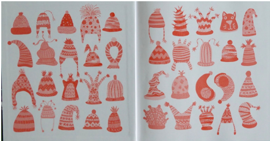
(Vorsatzblatt „Franks rote Mütze“)

➤ Mützen-Memory : Unabhängig davon, ob das Bilderbuch wiederholt eingesetzt werden soll, bietet es sich an, das Vor- bzw. Nachsatzpapier näher in den Blick zu nehmen.